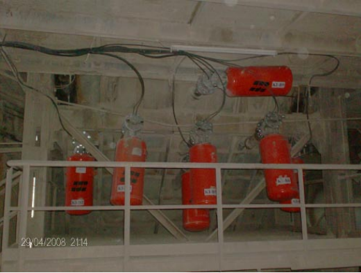
Martin Engineering Türkiye'den teknisyenler 31 adet Martin® Hava Şokunun kurulumunu gerçekleştirdi.